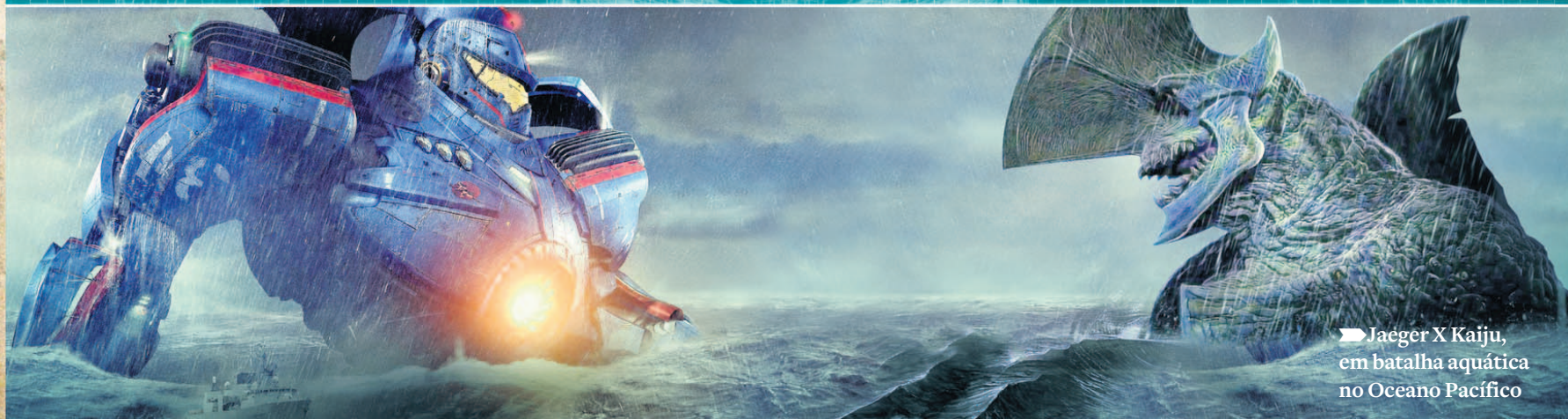
► Jaeger X Kaiju, em batalha aquática no Oceano Pacífico

O longa de 2008 mostra Nova York sendo destruída por uma criatura de origem desconhecida. Dirigido por Matt Reeves, mostra os eventos do ponto de vista da população.