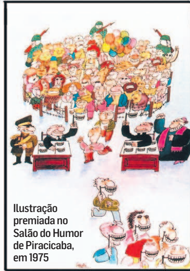
Ilustração premiada no Salão do Humor de Piracicaba, em 1975

Qual a influência de São Paulo no seu trabalho? O 'Pas-quim' tinha um humor muito carioca. Quando ele acabou, criamos uma festa nossa. São Paulo tem reflexo no meu trabalho: faço piadas urbanas que falam do cimento, da poluição e do comportamento do paulistano.